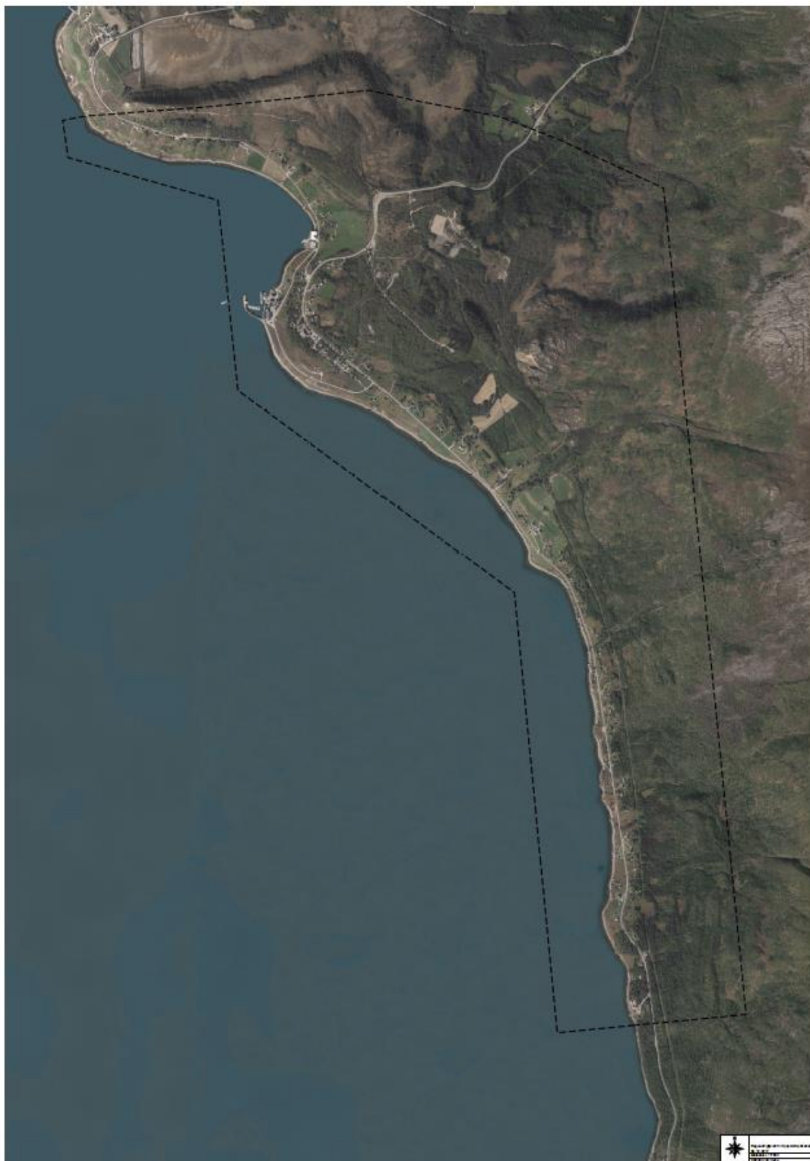
Fig 2 – Flyfoto med planavgrensning i sort stiplet linje. Hentet fra GIS 21.11.2017.